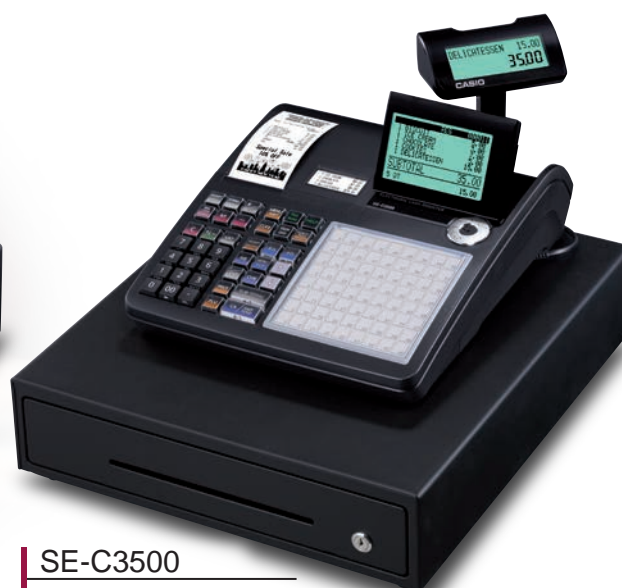
SE-C3500 ◀ 2-Stationen-Drucker ▶