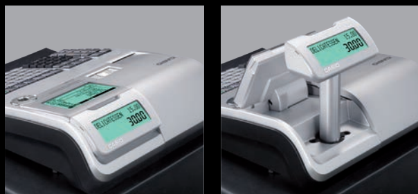
Anzeige dreh- und ausziehbar

Eine alphanumerische und verstellbare Kundenanzeige ermöglicht eine sehr gute Lesbarkeit für den Kunden. Das erzeugt Vertrauen bei Ihrem Kunden in eine fehlerfreie Registrierung.