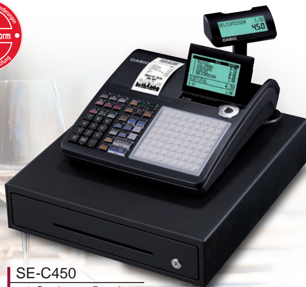
SE-C450 ◀ 1-Stationen-Drucker ▶